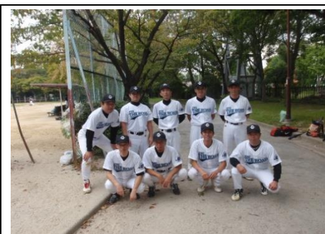
草野球チームでの活動