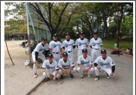
草野球チームでの活動