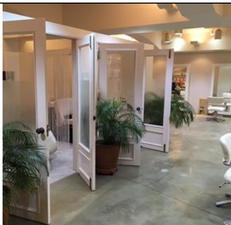
サロンコンセプトはリゾート また来たい・ずっといたいサロン