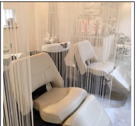
半個室シャンプースペース